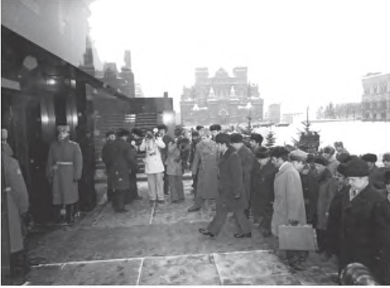
جانب من استقبال عبد السلام جلود في الاتحاد السوفياتي من ليونيد بريجنيف، وأعضاء الوفد في مراسم وضع إكليل من الزهور على ضريح فلاديمير لينين، 1978 / 2 / 15.